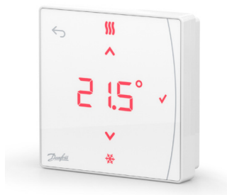
Danfoss Icon2™ RT 088U2121