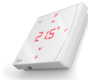
Danfoss Icon2™ Featured RT (IR sensor) 088U2122

Danfoss Icon2™ RT je rad bezdrôtových termostátov, ktorý umožňuje umiestniť termostát na ľubovoľné miesto bez obmedzení plynúcich z kabeláže v stene. Funkcia stmievania spolu s minimalistickým dizajnom, s hĺbkou len 16 mm, prepožičiava termostátu elegantný vzhľad a umožňuje mu splynúť s okolím.