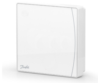
Danfoss Icon2™ Sensor 088U2120